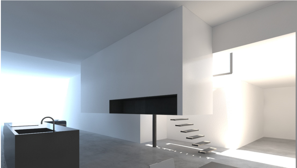
impressies ontwerp thomaskemme.nl