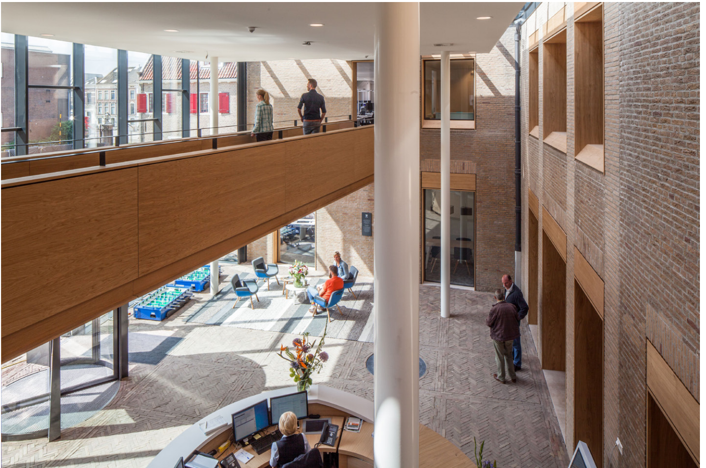
Voor de oorspronkelijk gevel is een glazen pui geplaatst, waardoor een overdekte entreezone ontstaat. De ramen in de oude gevel zijn vervangen door open houten kozijnen. Een eikenhouten loopbrug vormt de verbinding tussen twee gebouwdelen