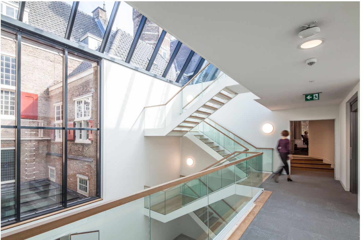
Het atrium vormt een overzichtelijk en centraal knooppunt in de routing met veel daglicht en doorkijkjes naar historisch Delft