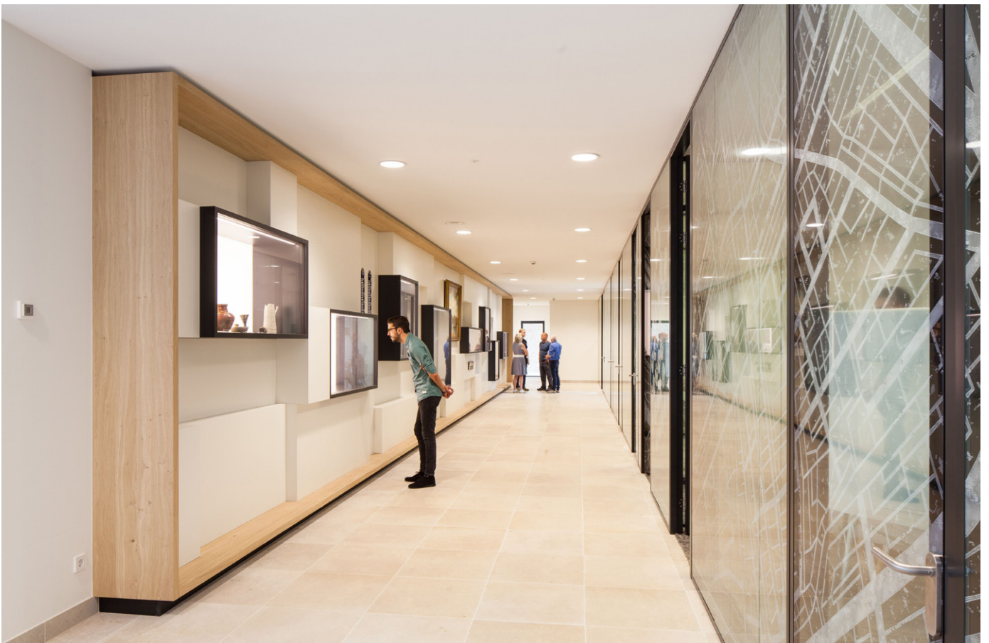
De Eregalerij met bijzondere objecten symboliseert de identiteit van het waterschap en verbindt de entreezone met het rijksmonument (Bouwdeel B en C)