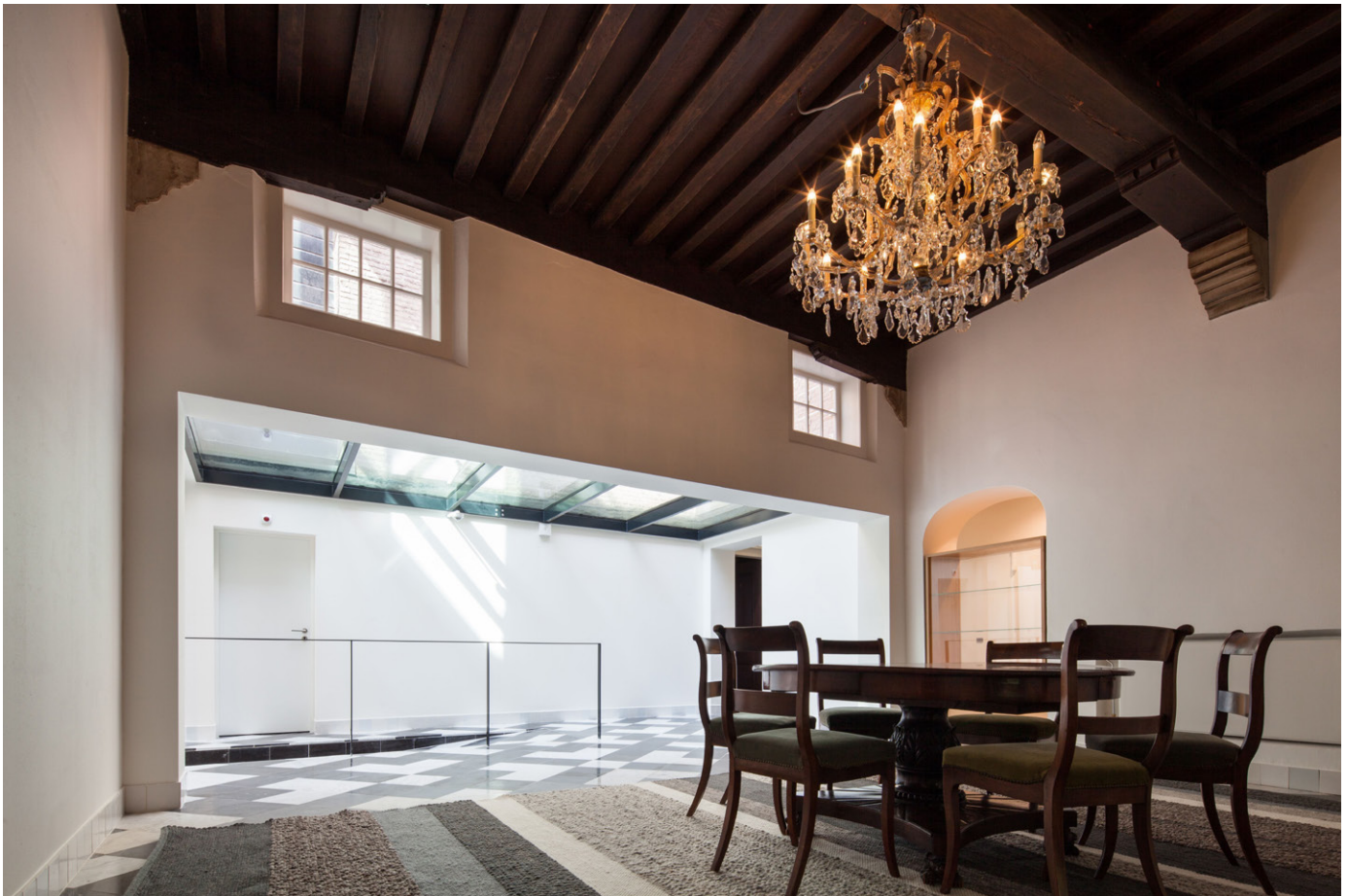
Het gebouw is door de integratie van hedendaagse techniek geschikt gemaakt voor flexibel gebruik met behoud van uitstraling