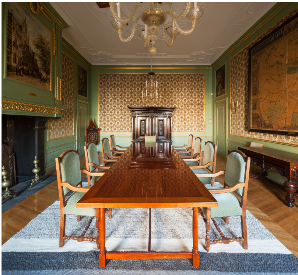
De stijklkamer is in ere hersteld en kreeg een (onzichtbare) technische upgrade